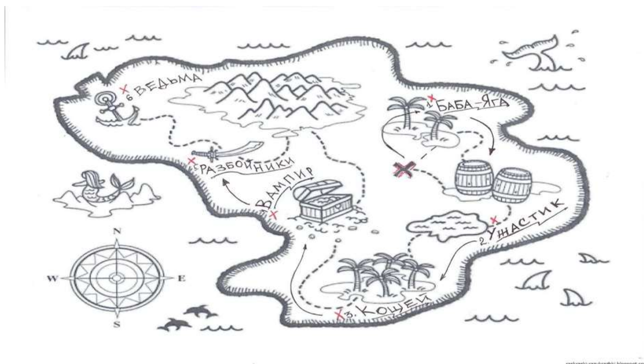
Отрядная карта (пример)

По окончании смены отряды защищают свои альбомы, рассказывают о том какие «знания - сокровища» они получили, путешествуя по трекам проекта «Орлята России».